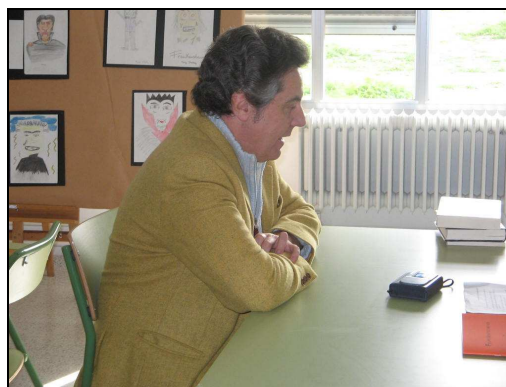
El escritor en la Biblioteca "Santiago Apóstol"

lecturas muy desordenadas. Nunca es un sólo libro a la vez. Voy cogiendo uno, voy cogiendo otro, siempre tengo como cinco o seis libros a la vez que estoy leyendo.